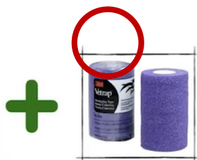
または類似のもの