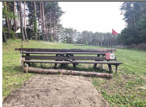
第 12 障害