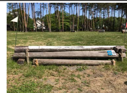
第 8 障害