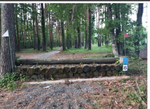
第 6 障害