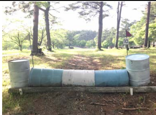
第 10 障害