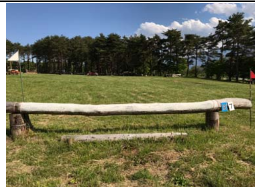
第 7 障害