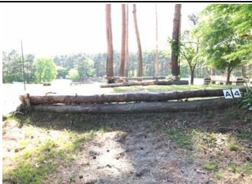
第 4 障害A