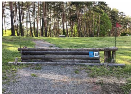
第 11 障害B