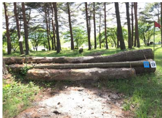
第 9 障害