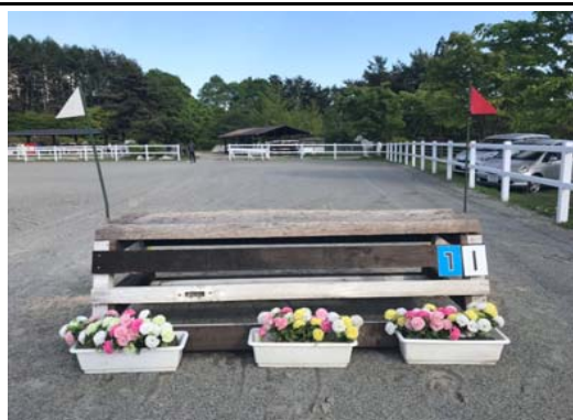
第 1 障害