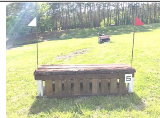
第 5 障害