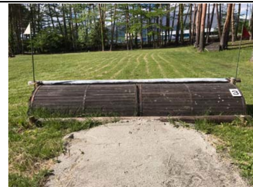
第 3 障害