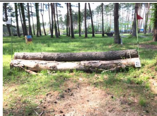
第 2 障害