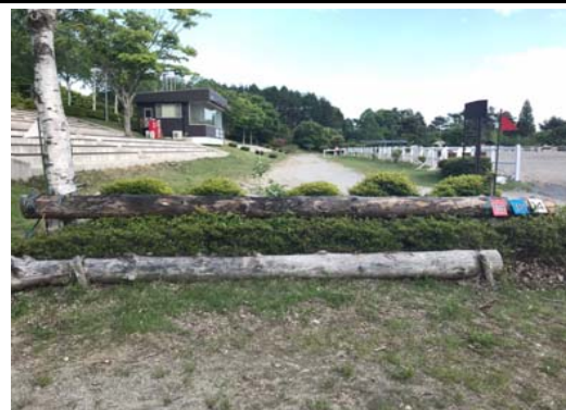
第 14 障害