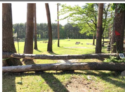
第 4 障害B