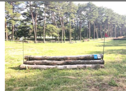
第 13 障害