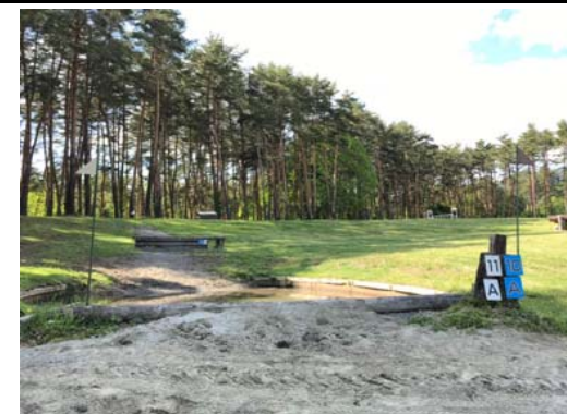
第 11 障害A